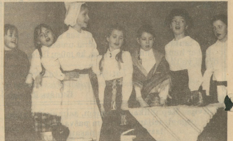
◆ Smaidoši, brīvi un dabiski uz skatuves jutās visu izrāžu dalībnieki. Laimiņas aktieri jo īpaši.