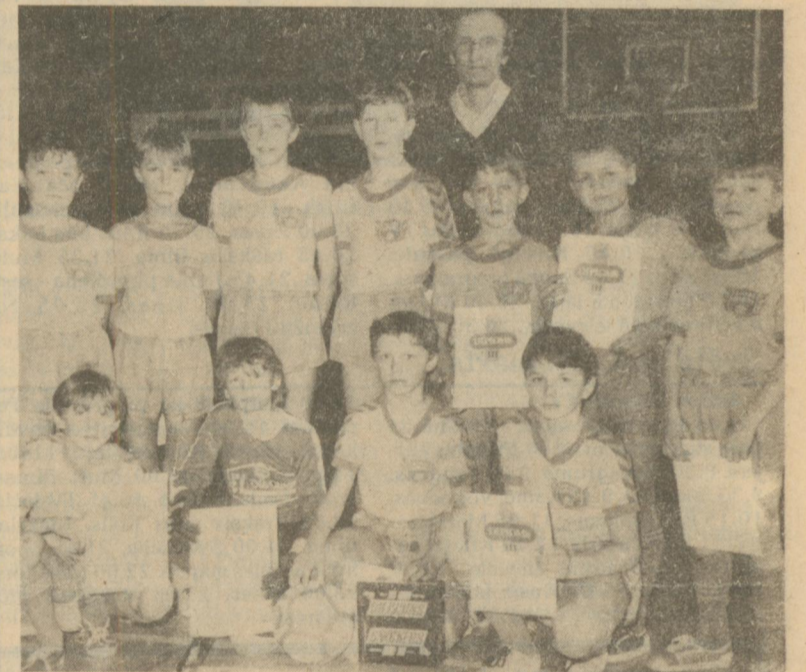
♦ «Cerības» jaunie futbolisti Latvijas jaunatnes minifutbola meistar-sacīkšu finālturnīrā izcīnīja 3. vietu.