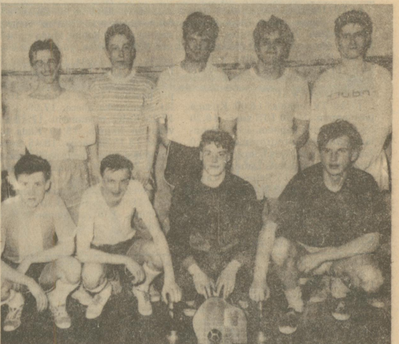
♦ «Parks» — Preiļu pilsētas čempions minifutbolā.