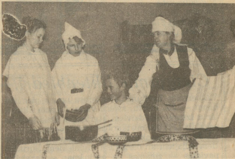
◆ Broņuks izkaro savas tiesības... (Rožupes pamatskolas izrāde «Cilvēka bērns»).

Līvānu 1. vidusskolas jauniešiem bērnišķīgas izrādes skatīties varbūt bija nedaudz garlaicīgi, jo vidusskolu grupā viņi bija vienīgi, kas bija atbraukuši kaut ko parādīt, un nebija, ar ko savus talantus salīdzināt. Uzstāšanās bija sagatavota speciāli šai reizei — ainiņas no mazas franču kafējnicas, ar vīnu, tango, varietē dejām, vakarkleitām, franču ievērojamāko literātu un mākslinieku sentencēm, frāzēm franču valodā. Jo skolā mācoties franču valodu... Dramatiskais kolektīvs šādā sastāvā spēlēja jau ilgāku laiku, arī Preiļos uzstājies, tradicionāli patukšā zālē, ar iepriekšējo nopietno iestudējumu «Pēdējais stāvs». Ar jaunajiem tēlotājiem dar-