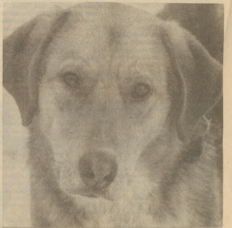
■ Laimīgu Jauno gadu! Lai Saņa gadā suns ir Jūsu sargs un draugs!