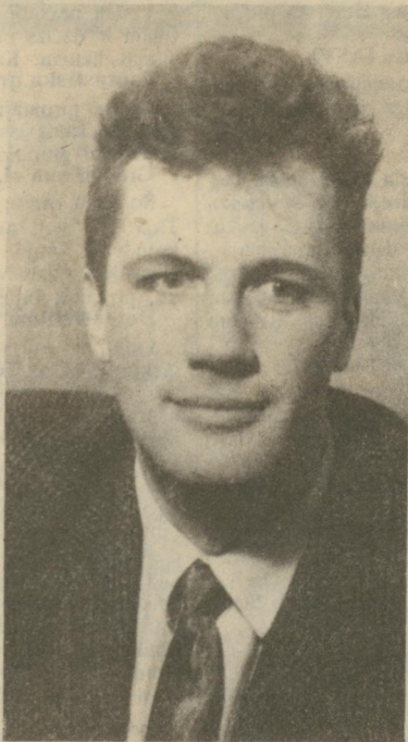
naudas maks kļuvis tik plans...

Mēs bez emocijām uzņēmām ziņu, ka mums atslēdz apkuri, atteica finansēšanu. Neuztrauca arī tas, ka uz laiku (ticam, ka tā) būsim spiesti izdzīvot, lūdzot un meklējot līdzekļus no firmām, lai bērnu un jauniešu vismaz aizvestu uz sacensībām. Bet mūs uztrauca tas, kādā veidā saņemām šo ziņu. Lūk, «Cerību» pārtrauks finansēt, zāli neapkurinās. Ja vēlaties, varat durvis klapēt ciet. Korektāk būtu, ja tie, kas vada rajonu, vispirms ar mums būtu apsprieduši iespējas, kā «Cerībai» turpināt darbu, ja budžeta