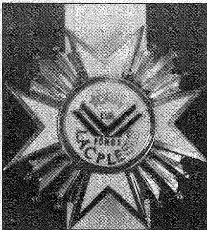
● Latvijas Valsts aizsardzības fonda «Lāčplēsis» Goda zīme.

Latvijas Valsts aizsardzības fonds «Lāčplēsis» nodibināts 1996. gada 2. maijā, un tā uzdevums ir maksimāli sekmēt Latvijas valsts drošību no ārējiem un iekšējiem apdraudējumiem, tāpat, — veicināt aizsardzības un drošības institūciju darbību, nacionālās ekonomikas un kultūras attīstību, kā arī veicināt Latvijas iedzīvotāju, it īpaši jaunatnes, patriotisko audzināšanu. Kā to izdarīt? Palīdzot veidot tādu vidi, kurā būtu izskausta vardarbība un kurā varētu brīvi attīstīties cilvēku radošās spējas un atbildība par savu valsti, uzsver fonda prezidents Jānis Ivars Kasparsons. «Fonds atbalsta zinātniski pētniecisko darbu aizsardzības, izglītības un sociālekonomisko