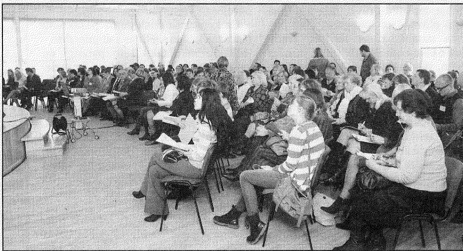
● Preiļu un apkārtējo novadu iedzīvotāji pirmajā forumā sprieda, kā uzlabot savas dzīves kvalitāti papildus tam, ko piedāvā pašvaldība.

Aglonas novadā notikušās apkaimes darbnīcas dalībnieki izteica ierosinājumus