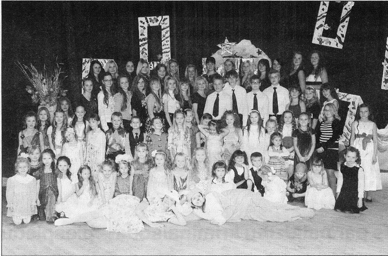
● Livānu vokālās studijas «Spurgaliņas dalībnieki pēc 20 gadu jubilejas koncerta.

Skatītāju apbrīnas, tuvinieku un draugu mīlestības gaisotnē savu 20. dzimšanas dienu atzīmēja Livānos populārākā, lielākā un senākā vokālā studija «Spurgaliņas».