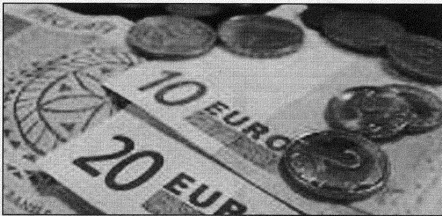
● Pēc eiro ieviešanas vienlaicīgi eiro un latos varēs lietot divas nedēļas.

Tāpat EIL noteic, ka sešus mēnešus bez komisijas maksas varēs veikt skaidrās naudas apmaiņu visās kredītiestādēs, vienu mēnesi – «Latvijas Pasta» un bez termiņa ierobežojuma – Latvijas Bankā. Savukārt Ministru kabinets savlaicīgi noteiks tās «Latvijas Pasta» atsevišķās pasta pakalpojumu sniegšanas