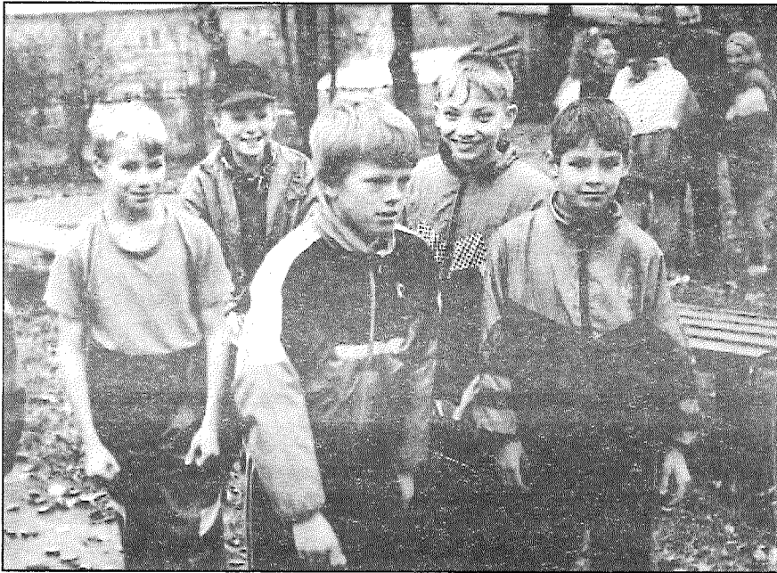
● Tā draugu pulkā ir drošāk steigties pēc uzvaras...

Atvasaras skaisto brīžu noskaņu vairoja Preiļu 2. vidusskolas stadionā notikušās «Lēcēju dienas» sacensības, sponsoru balvas un sasniegtie rezultāti. Jau piekto gadu pēc kārtas šādas Preiļu pilsētas atklātās sacensības rīko un vada Preiļu 2. vidusskolas fizikultūras skolotāji, piesaistot sponsorus balvu iegādei.