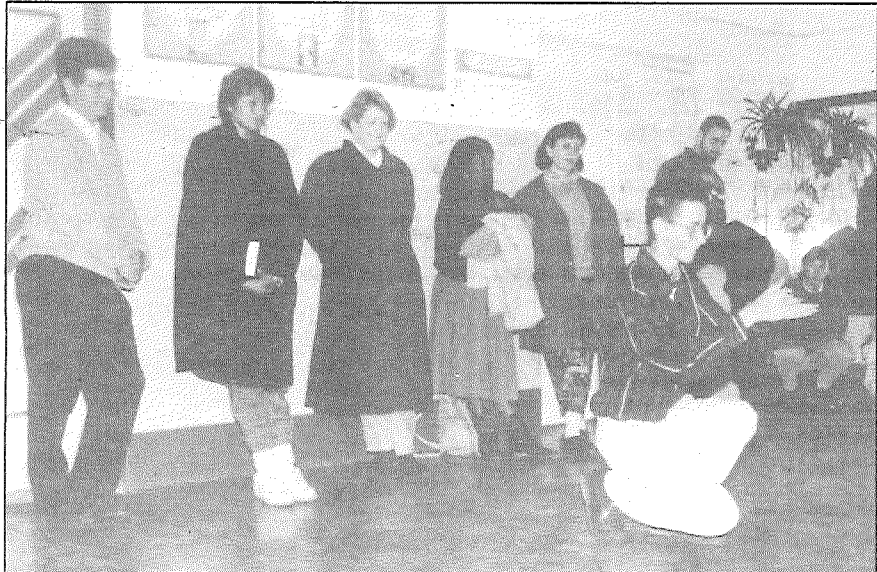
● Starptautiskās kristīgās organizācijas «Jaunatne ar misiju» pārstāvji tikšanās laikā Līvānu 1. vidusskolā.

12. oktobrī Laimiņas skolā un Līvānu 1. vidusskolā un 14. oktobrī Līvānu bērnu mākslas skolā ieradās pārstāvji no Starptautiskās kristīgās organizācijas «Jaunatne ar misiju» — 17 dažādu paaudžu cilvēki, kuri pārstāv 11 nācijas no Ēģiptes, ASV, Anglijas, Šveices, Norvēģijas, Vācijas, Francijas, Indonēzijas. Viņi satikušies Šveicē, bet nākuši no dažādām valstīm un ir personības ar dažādiem uzskatiem. Bet ir kas kopējs, kas viņus vieno, — viņi pielūdz vienu Dievu, lai gan pārstāv dažādas konfesijas.