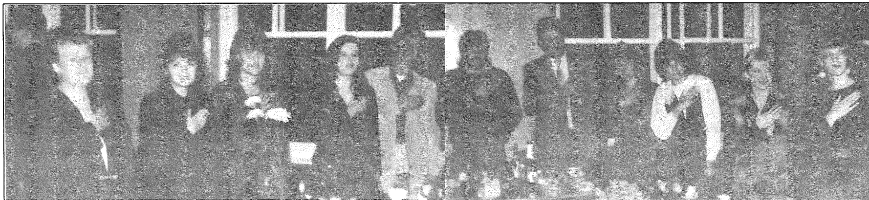
● «Zvēru, ka mans garstāvoklis būs lielisks...» Līvānu 1. vidusskolas skolotāju kolēģi no Jēkabpils rajona Atašienes vidusskolas.

Katru gadu oktobrī, kad krāsainās rudens lapas vēl spītīgi turas pie koku zariem, ir svētki skolotājiem — radošajiem, mīļotajiem un nīstajiem, arī spītīgajiem un izturīgajiem.