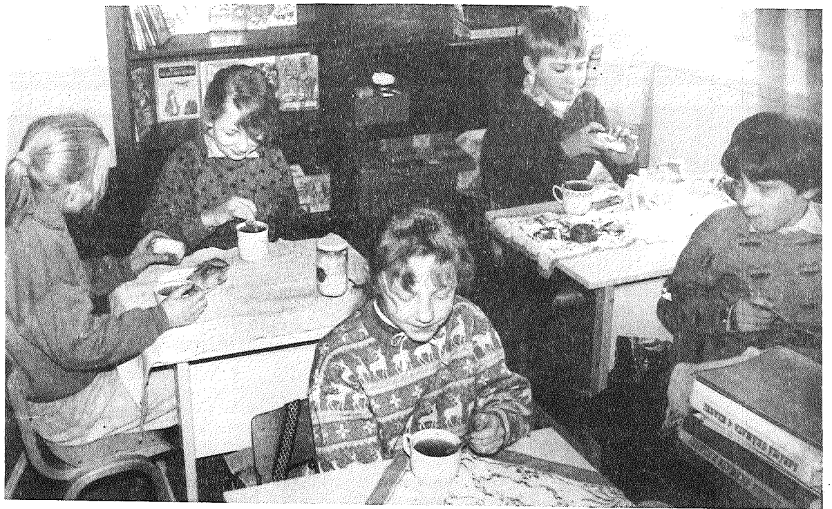
■ No mājām nestajās krūzītēs smaržo Arendoles pļavu ziedu tēja. Ir starpbrīdis.

Neuzvedīgais februāris vienu pēc otras logos triec slapjas brāzmas, bet skolnieciņi par to nebedā. Silti piekurināta krāsnis, sausas kājas, karsta tēja krūzītē un mamas dotās sviestmaizes uz skolas soliēm. Apmēram šajā laikā visās skolās ir garais starpbrīdis un pusdienošana. Bērni ieturas nesteidzīgi, jo neviens te negrasās atpemt