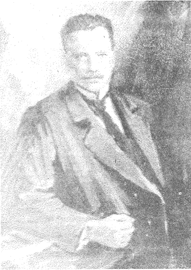
24. DECEMBRI PAIET 115 GADI KOPŠ FRANCA KEMPA DZIMŠANAS.