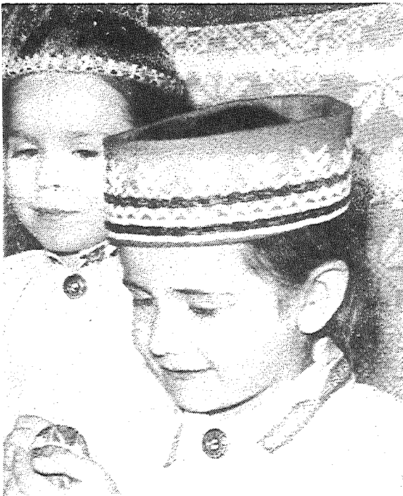
Attēla: meitene priekšplanā ar Latgales vainagu, bet otrā meitene — ar Krustpils vainagu.