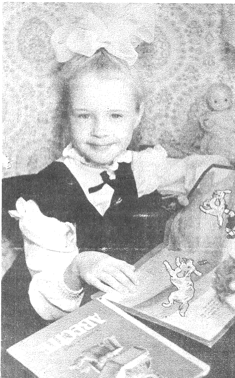
□ 1.septembrī - uz skolu