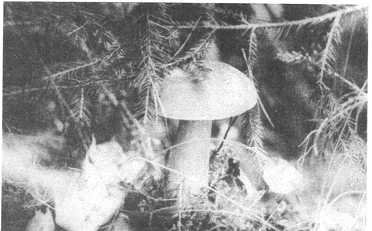
□ Sēņu laikā.