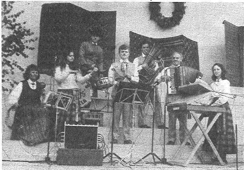
● Играет сельская капелла «Итоль».

15.30 — постановка-концерт на парковой эстраде. Участвуют гости из Дании, Грузии, Эстонии, Литвы, фольклорная группа «Макарс», фольклорные ансамбли и сельские капеллы из Екабпилского, Резекненского, Лудзенского, Даугавпилского и Краславского районов, латышская фольклорная группа из Сибири.