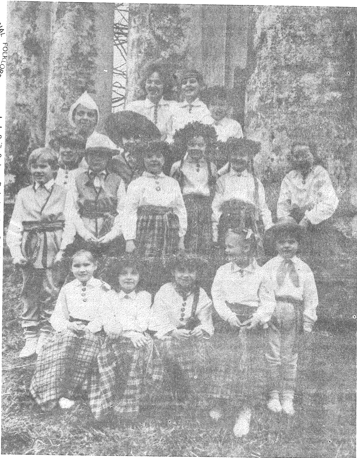
■ Līvānu jaunrades nama folkloras ansamblis

PREIĻU RAJONA TAUTAS DEPUTĀTU PADOMES PREZIDIJS UN IZPILDKOMITEJA