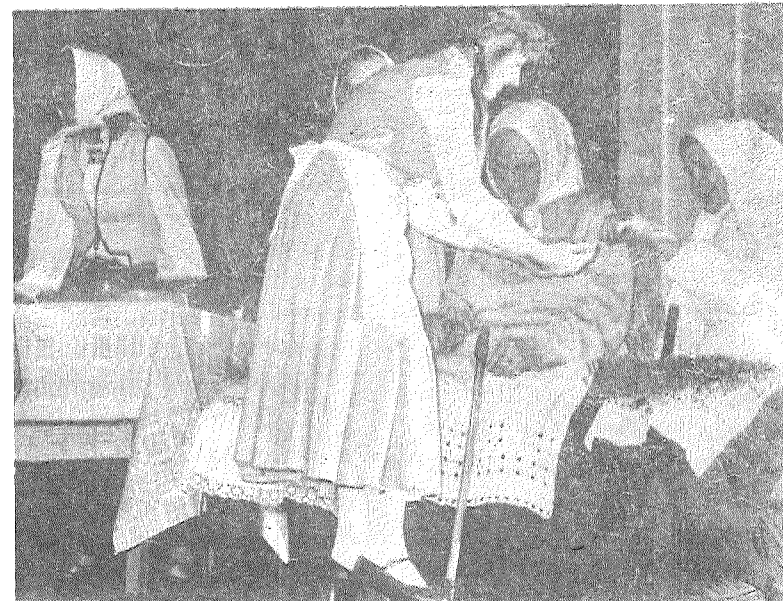
■ Saunas ansambļa daļiņnieces »Linu talkas» uzvedumā Rēzeknē.