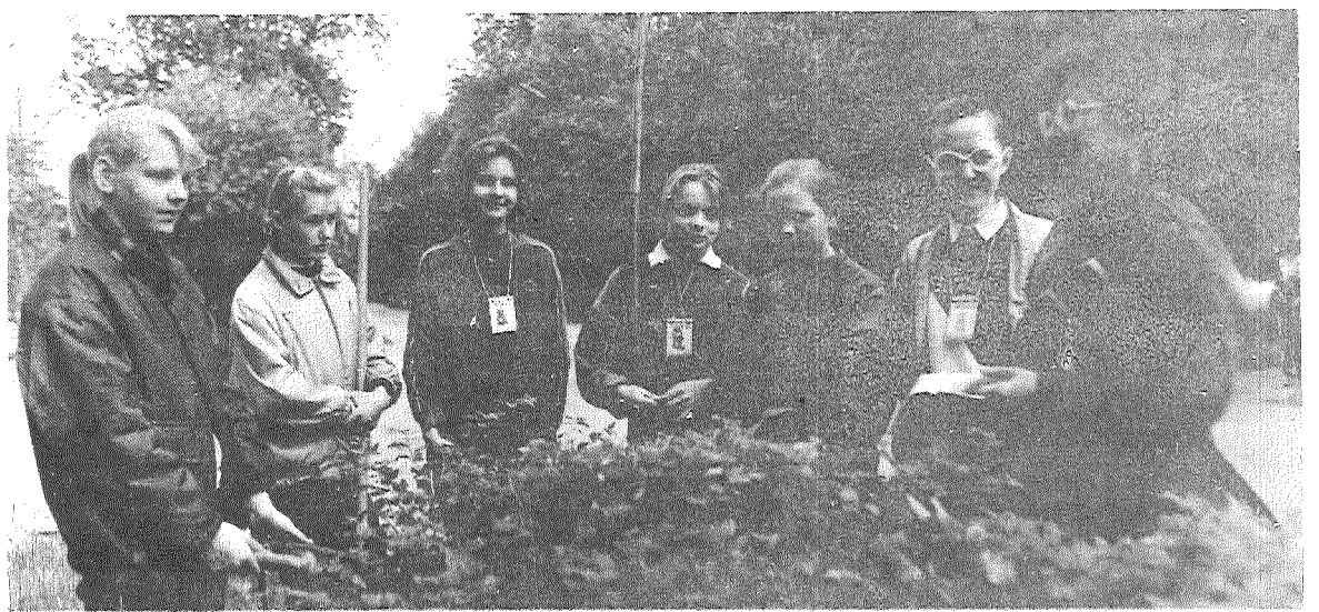
Līdz ar silta laika iestāšanos vasaras brīvlaikā Preiļos sākuši darbu minilotosi. Skolēnu pārzinā - pilsētas jāzās rotas uzkopšana. Attēlā: šie puikas un meitenes strādā minilotosā „Kukaiņi-91“.