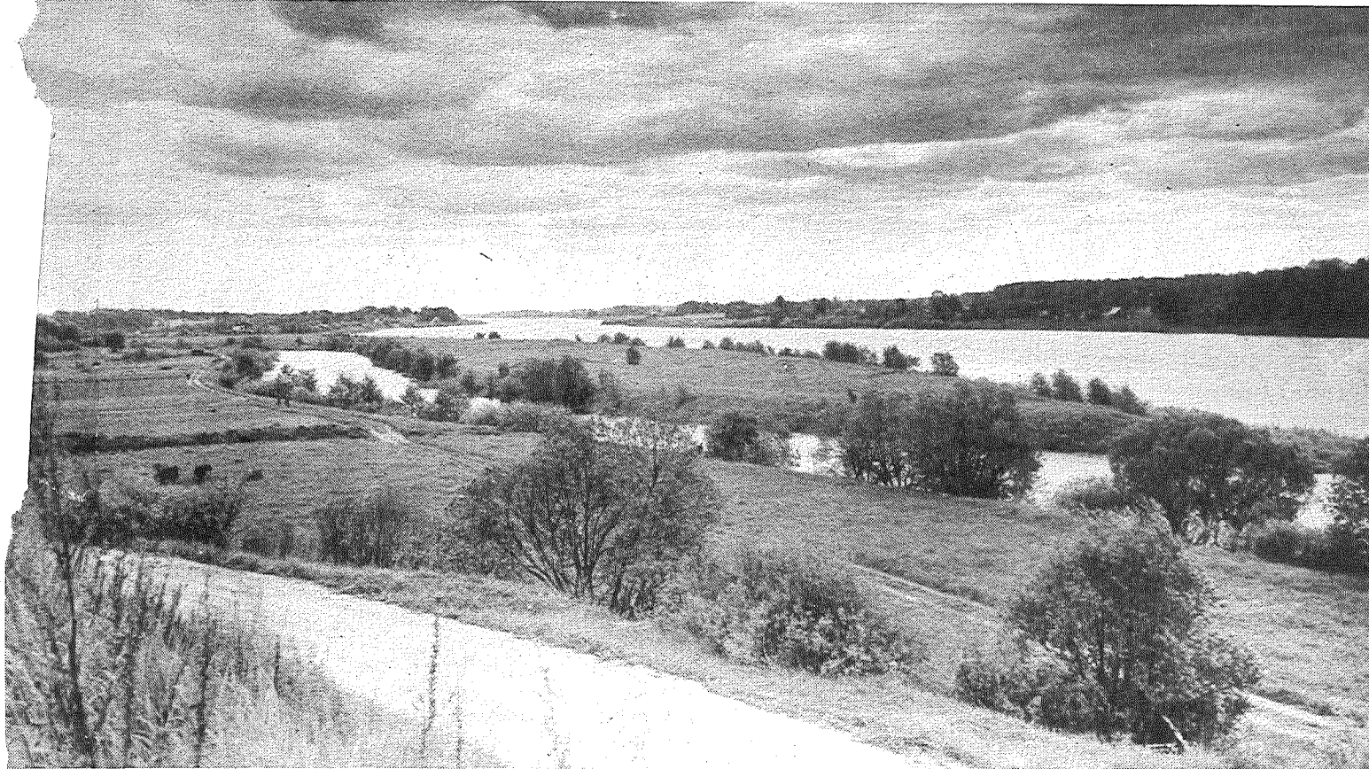
Te Dubna ar Daugavu tiekas...