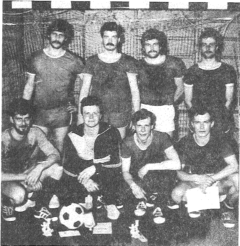
STARPSAIMNIECĪBU CELT-NIECĪBAS ORGANIZĀCIJAS futbola komanda, kas kļuva par Preiļu pilsētas čempionāta uzvarētāju minifutbola sacensībās.