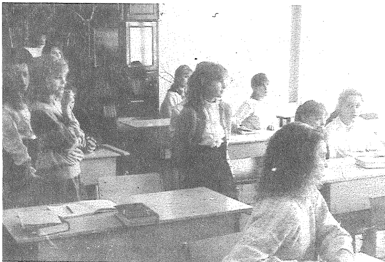
ATELĀ: angļu valodas olimpiādē.