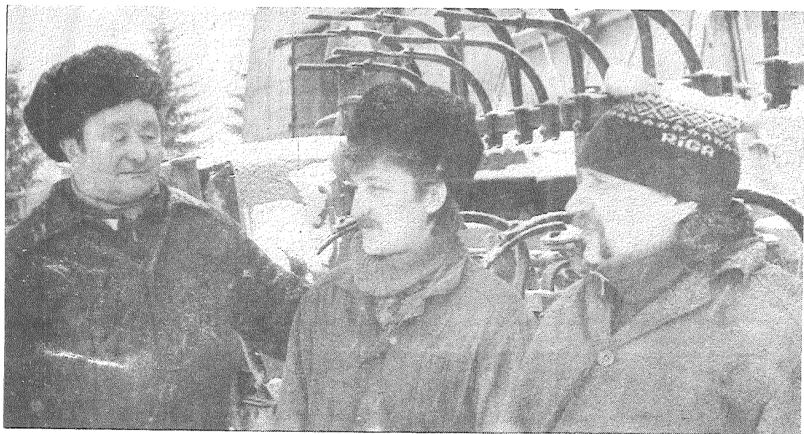
Līvānu stikla fabrikā