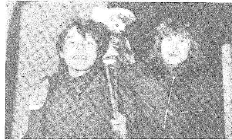
Meteņi Preiļu parkā.