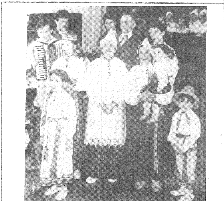
ATTĒLA: dzied Vaivodu-Kārķļu ansamblis. Ieskats rajona folkloras ansambļu skatē sniegts 3. lappusē.